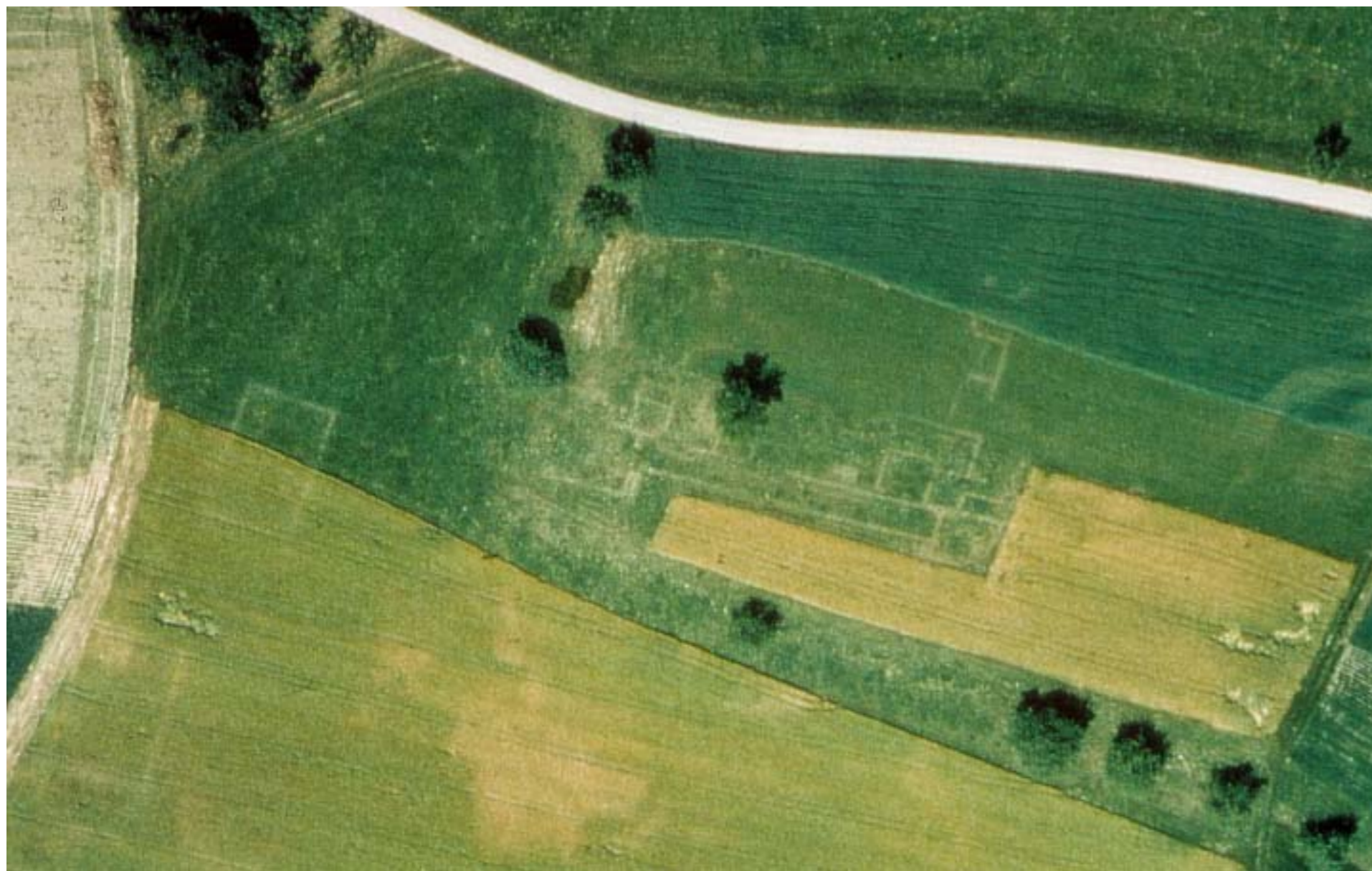
Luftbild des Landesdenkmalamtes Baden-Württemberg von 1989. Dicht unter dem Humus liegende Mauerreste des Haupthauses zeichnen sich deutlich im Pflanzenkleid ab. In heißen Sommern wird das Gras auf den Mauern schneller dürr. Ist Getreide angepflanzt, so reifen die Ähren auf den trockenen Mauern schneller und bilden den Mauerverlauf helle Linien im noch grünen Feld ab.