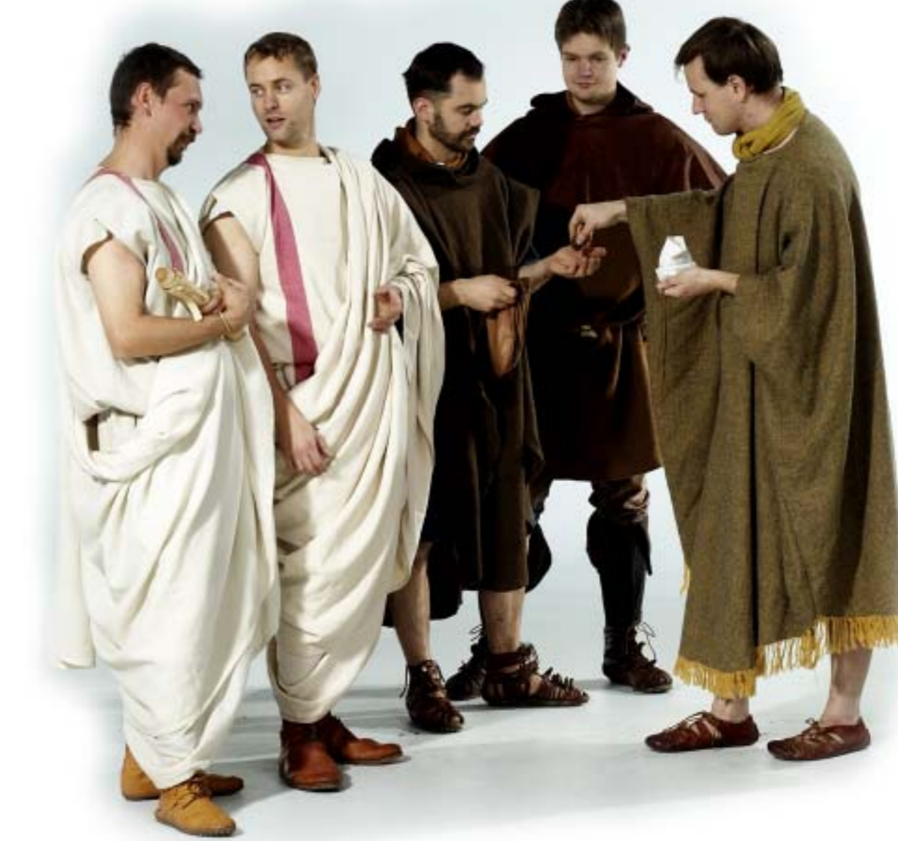
Römische Händlerszene und Legionäre.

Die Villa rustica von Münchhöl-Homberg wurde vermutlich in den letzten Jahrzehnten des ersten Jahrhunderts gegründet und dürfte spätestens mit der Rückverlegung der römischen Grenze an den Bodensee um 260 n.Chr. aufgegeben worden sein.