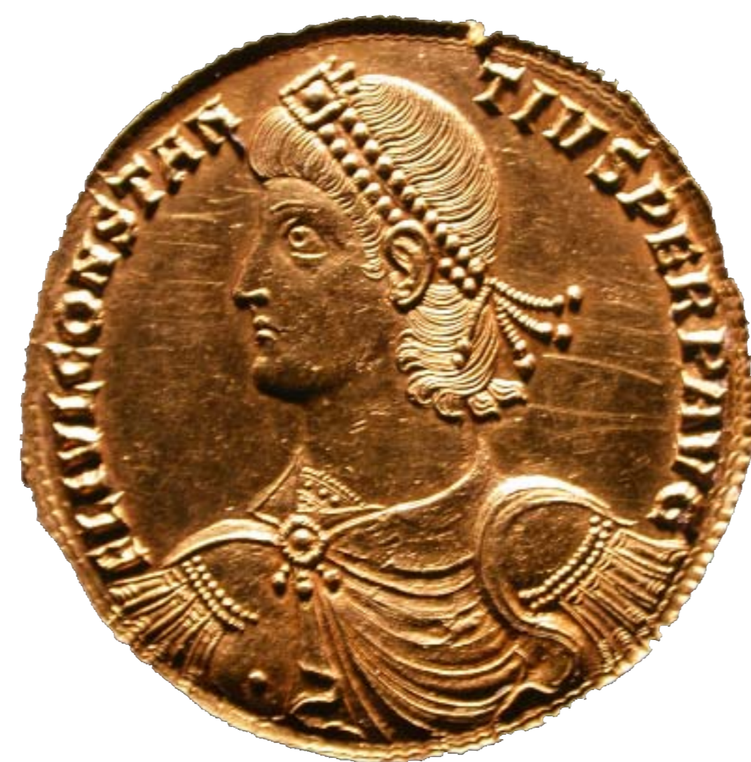
In den 1930er Jahren wurde nahe des Gutshofes ein Goldmedaillon des Kaisers Constantius II. (Regierungszeit 337-361 n. Chr.) gefunden. Das Würdezeichen wurde an hochrangige römische Offiziere oder verdiente Zivilpersonen verliehen. Wie das wertvolle Stück im vierten Jahrhundert in den von Römern bereits verlassenen Hegau gelangte, ist ungeklärt.

Württemberg. Die erwirtschafteten Überschüsse des Landgutes wurden wohl in die römische Siedlung nach Orsingen verhandelt.