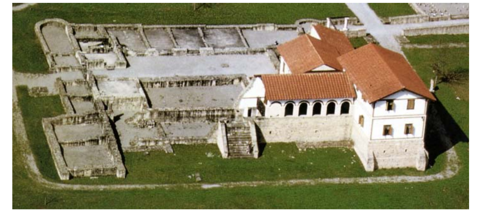
Luftbild des teilrekonstruierten Haupthauses von Hechingen-Stein. Ähnlich dürfte auch das Gutshaus von Münchhöl-Homberg ausgesehen haben. Zur säulengetragenen Eingangshalle führt eine Steintreppe. Die Vorderfront wird von zwei vorspringenden Türmen flankiert. Die Dächer waren mit Ziegeln gedeckt, die Mauern verputzt und bemalt. In den Türmen und den Räumen um den Innenhof lebte der Gutsbesitzer und seine Familie. Die Fenster waren verglast und ein Teil des Gebäudes konnten mit einer Fußbodenheizung (Hypokaustanlage) beheizt werden.

Der römische Gutshof von Münchhöl-Homberg wurde 1901 erstmals beschrieben. Auf unsystematische Schürfungen folgten in den 1930er Jahren erste Aufmessungen und Probegrabungen durch A. Funk und P. Revellio. 1989 konnten mit Hilfe von Luftbildern weitere Baudetails erkannt werden. Die etwa 270 x 200 m große Gutsanlage erstreckt sich über einen flachen, nach Südosten geneigten Hang und war von einer Hofmauer umgeben. Auf der höchsten Stelle des „Dammbühls“ stand an prominenter Stelle das repräsentative Haupthaus. Es handelte sich um ein stattliches Gebäude mit turmartigen Vorsprüngen an den Ecken der vermutlich von Säulen getragenen Eingangshalle (porticus). Der offene Innenhof war von Seitenflügeln, die mehrere Räume erkennen lassen, eingegrenzt. Die Mindestausmaße des Gebäudes dürften etwa 70 x 60 m betragen haben. Wenig östlich stand das Badegebäude, das einen festen Bestandteil jedes größeren römischen Gutshofes bildete. Die Funktion zweier kleinerer Gebäude und eines run-